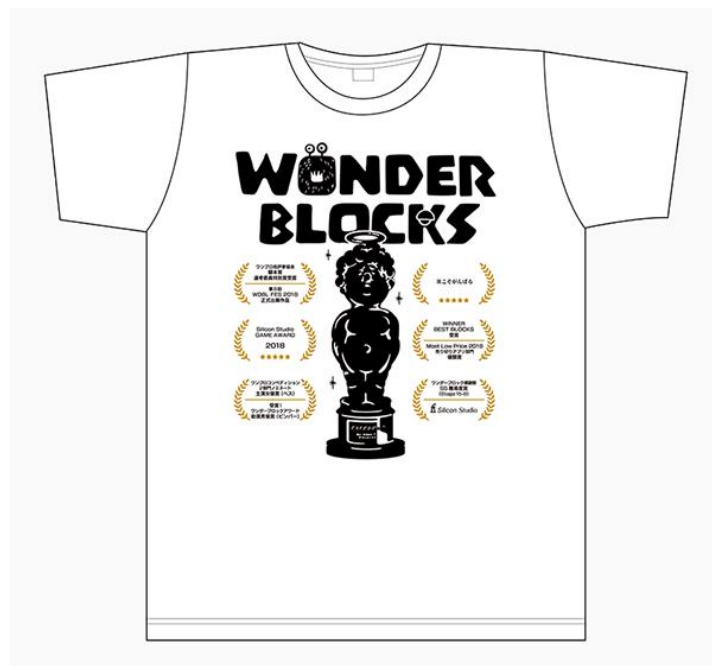
オリジナル T シャツ（画像は製作中のものです。実際の製品とは異なる場合があります。）

【Facebook】 https://www.facebook.com/siliconstudiojp/