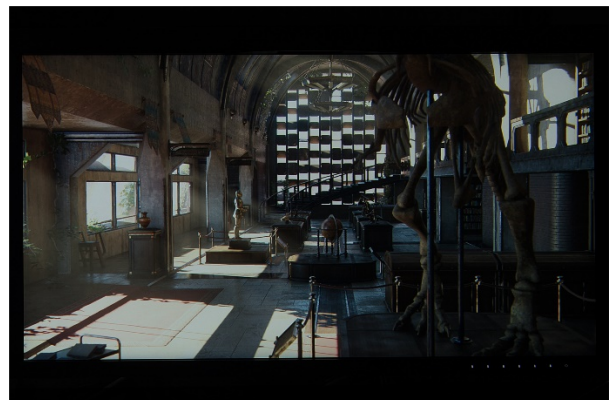
左：HDR 対応版 右：SDR 版 ※モニタに表示した様子を撮影した写真