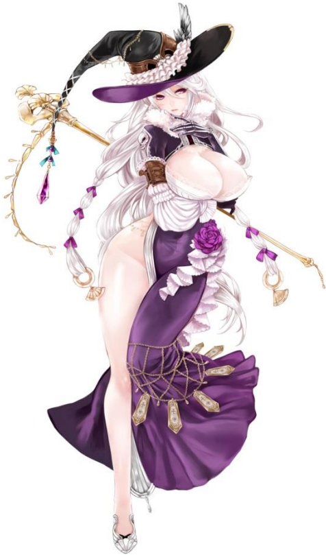
フロエスト王国 アンジェラ女王