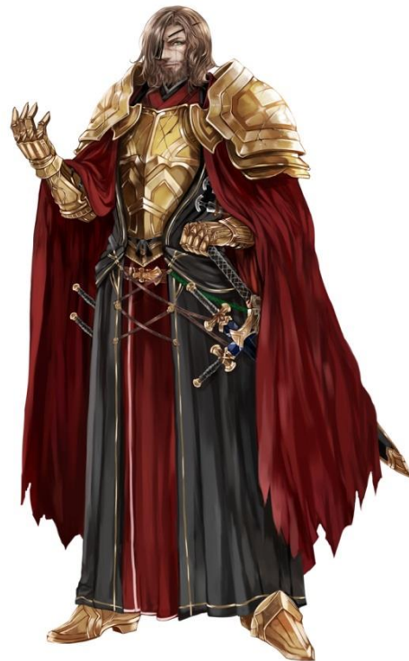
バルドニア連邦国 獅子王レオン