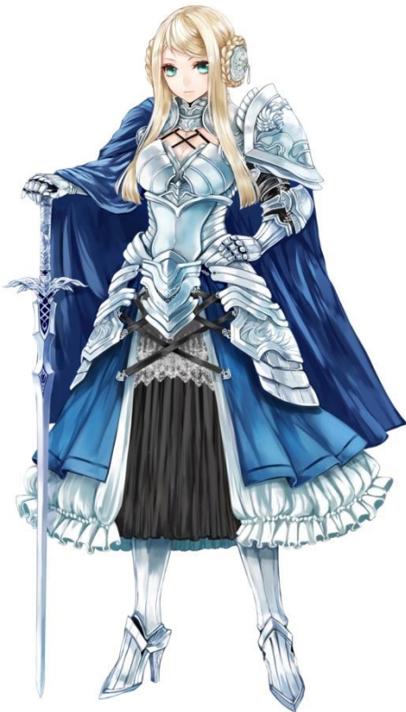
オルディア共和国 聖女シャルロット