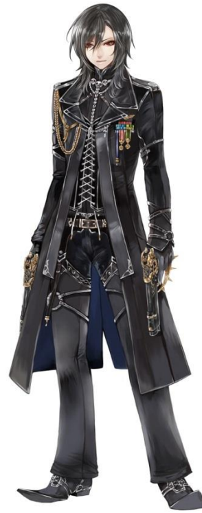
ベルドナ帝国 皇帝ヴィンセント