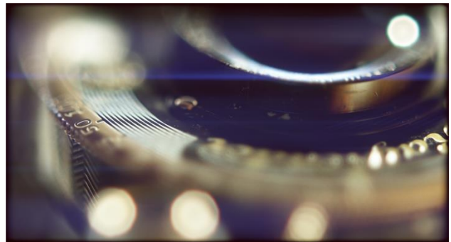
アポクロマートレンズ