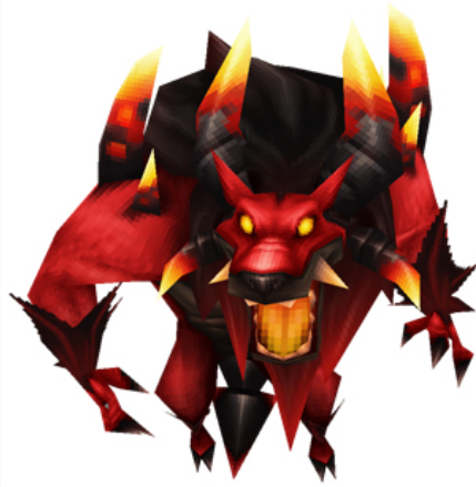
イフリート最終進化「キングイフリート」3D モデル