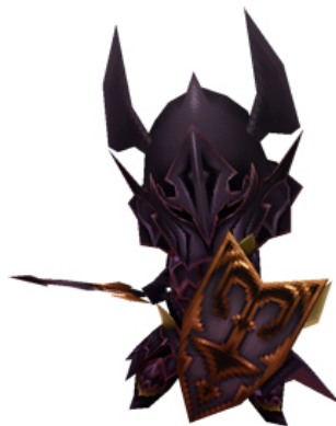
ゴーストナイト最終進化「ファントムナイト」3D モデル