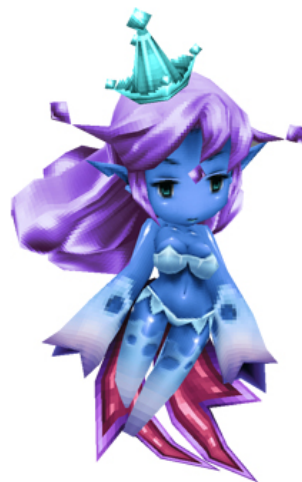
ウンディーネ最終進化「ウンディーネラクス」3D モデル