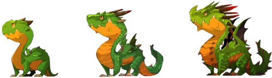
「ドラゴン（木属性）」左から初期状態、1段進化、最終進化