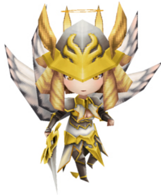
エンジェル最終進化「エンジェルロード」3D モデル