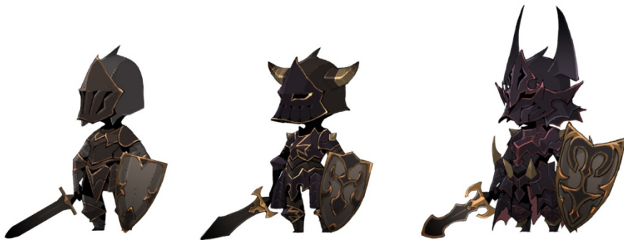
「ゴーストナイト（闇属性）」左から初期状態、1段進化、最終進化