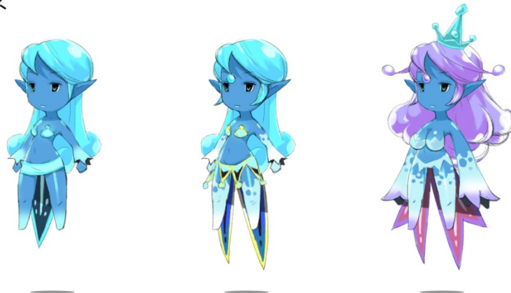
「ウンディーネ（水属性）」左から初期状態、1段進化、最終進化