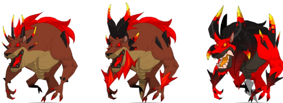
「イフリート（火属性）」左から初期状態、1段進化、最終進化