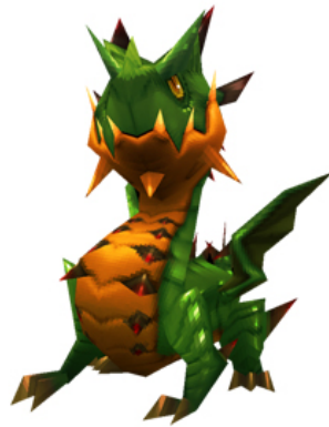
ドラゴン最終進化「アークドラゴン」3D モデル