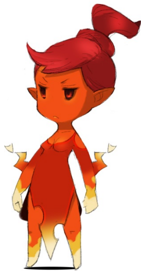
「フレリア」(イラスト)