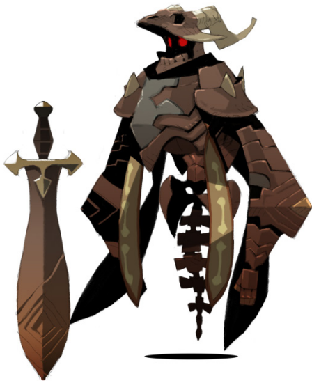
イベントボス「ヴォルグール」(イラスト)