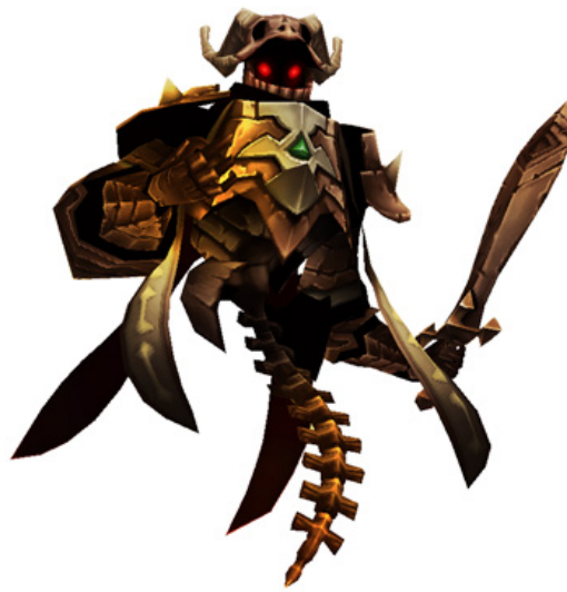
「ヴォルグール」(3Dモデル)