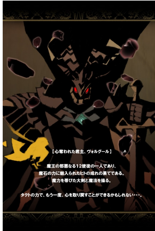
「ヴォルグール」のストーリー