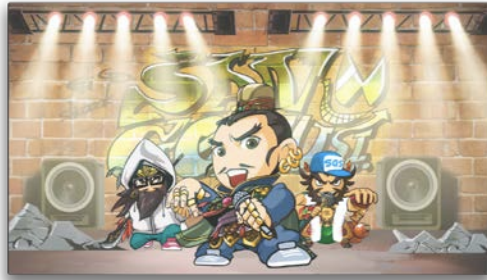
「おめーら三国志 mo チェックしてけ」