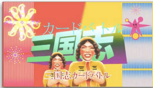
「三国志カードバトル」