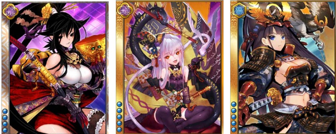
左から「織田信長」「齊藤道三」「徳川家康」