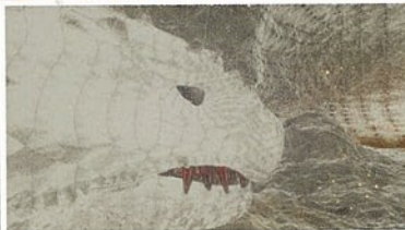
01. [G]ゲームエンジンParadox+YEBIS 2 技術デモ