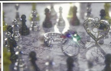
02. [G]ポストエフェクトモデルウェアYEBIS 2 技術デモ