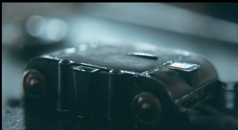
スタンダードレンズのシミュレーション

逆光のような光、ボケ、ノイズなど、 カメラのレンズで起こるさまざまな 光学現象を正しくシミュレートする ことで、リアルタイム CG でありな がら実写と見まごうほどの豊かな空 気感を表現できます。