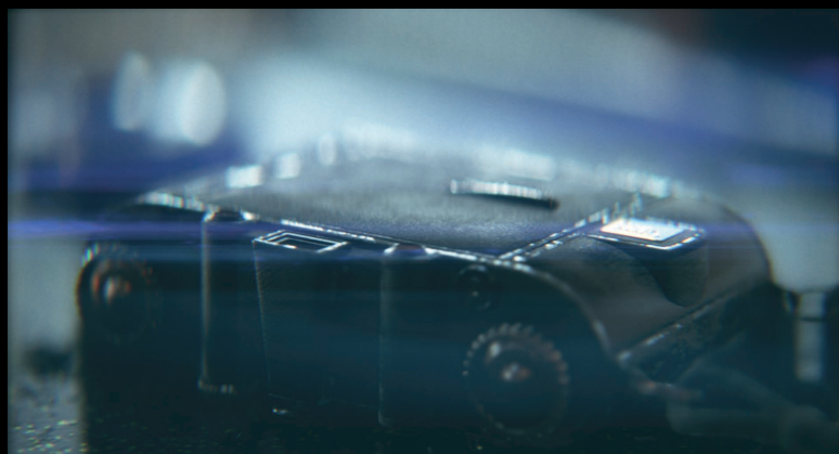
アナモルフィックレンズのシミュレーション

アナモルフィックレンズのシミュレ ーションにより、水平に伸びるよう に現れるフレアや楕円ボケ、横方向へ 強く生じるディストーションや倍率 色収差、縦横の非点収差など、映画 で見られるような特徴的な現象を再 現できます。