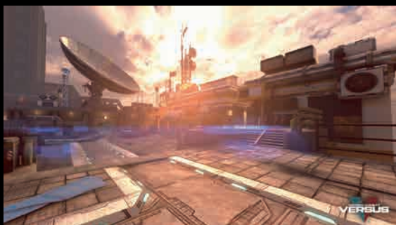
モダンコンバット Versus