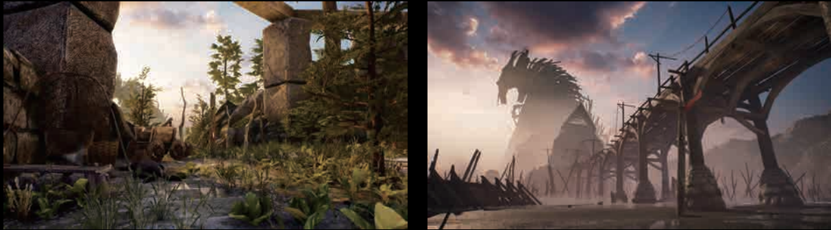
Hellblade: Senua's Sacrifice / Ninja Theory Ltd.

Enlighten は PBR/HDR パイプラインに最適です。リアルタイムリフレクションにより、金属や濡れた表面をリアルに表現し、HDR 品質を最大限に引き出します。