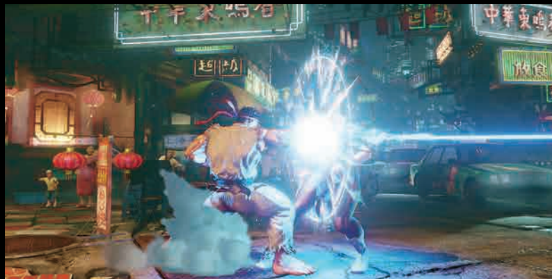
ストリートファイターV アーケードエディション ©CAPCOM U.S.A., INC. 2016, 2018 ALL RIGHTS RESERVED.

ライトやマテリアルが変わると、ゲーム内でリアルタイムに GI が更新されます。これにより昼夜のサイクルや、プレイヤーがランタンや松明などを持って歩きまわるなど、プレイヤー制御のライトを利用したゲームプレイが可能となります。