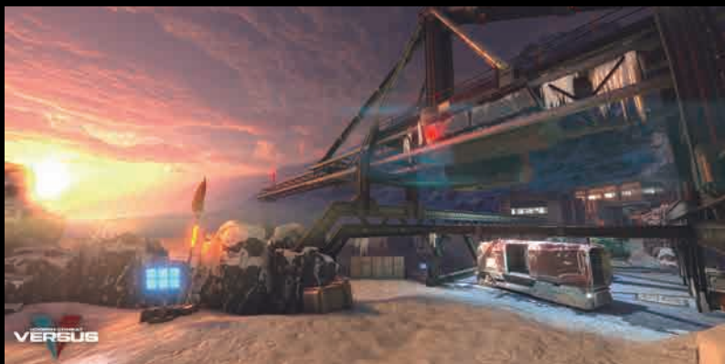
モダンコンバット Versus ©2018 Gameloft. All rights reserved. Gameloft and the Gameloft logo are trademarks of Gameloft in the U.S and/or other countries.

Enlighten は狭い室内空間から広大なオープンワールドまでさまざまなスケールに対応可能です。どのような種類のゲーム制作においても統一されたワークフローで開発が行え、屋内外を組み合わせ合わせたゲームワールドでも高い効果を発揮します。