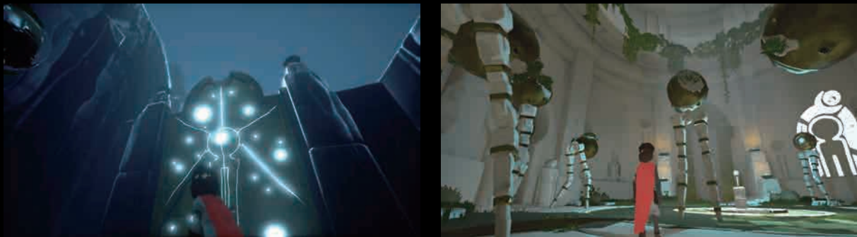
RIME © 2017 Tequila Works. All rights reserved.

高度なライティング技術であるエミッシブサーフェスを有効化することで、すべてのサーフェスを動的に変更可能なダイナミックエアライトにすることができます。