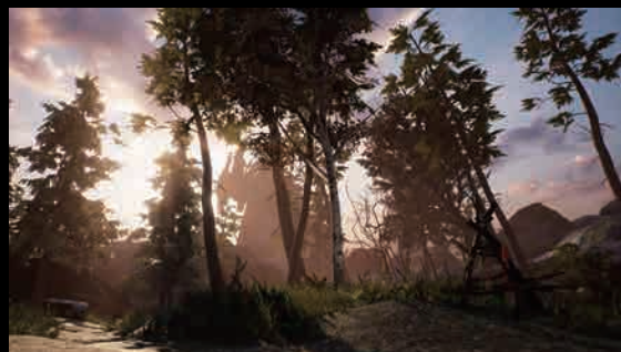
Hellblade: Senua's Sacrifice

© 2017 Tequila Works. All rights reserved.