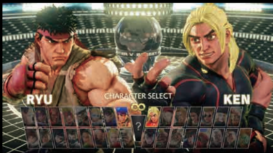
ストリートファイター V アーケードエディション

Enlighten は、数多くの人気作品や AAA のゲームタイトルにメリットをもたらしてきた実績豊富なテクノロジーです。