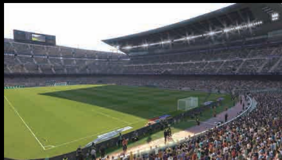
ウイニングイレブン 2019

©CAPCOM U.S.A., INC. 2016, 2018 ALL RIGHTS RESERVED. Street Fighter is a registered trademark of Capcom U.S.A., Inc. All other marks are the property of their respective owners.